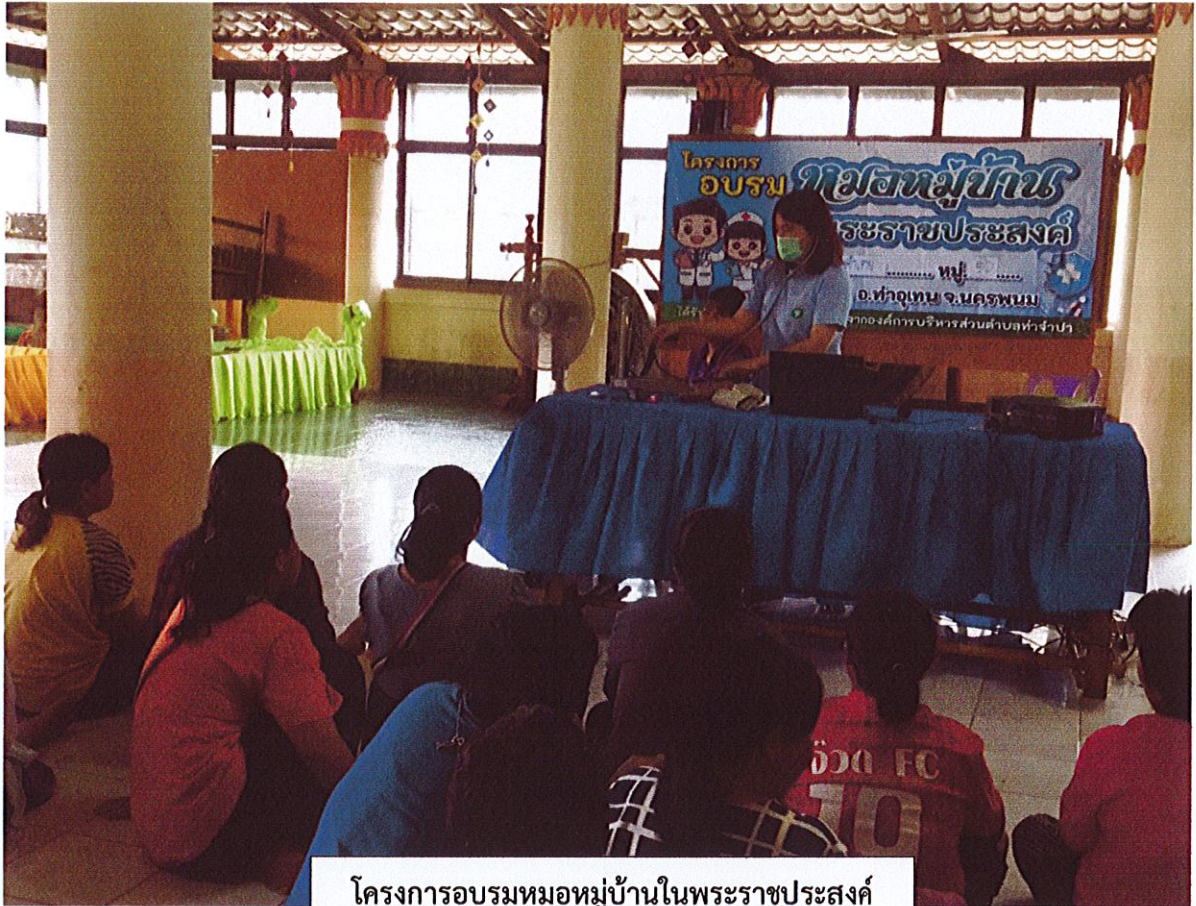
โครงการอบรมหมอบ้านในพระราชประสงค์ บ้านคำเตย หมู่ ๑๖ ตำบลท่าจำปา วันที่ ๒๐ เดือนกันยายน พ.ศ.๒๕๖๖