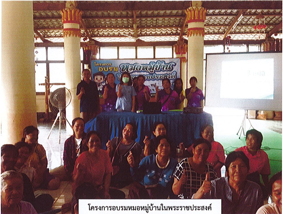
โครงการอบรมหมอบ้านในพระราชประสงค์ บ้านคำเตย หมู่ ๑๖ ตำบลท่าจำปา วันที่ ๒๐ เดือนกันยายน พ.ศ.๒๕๖๖